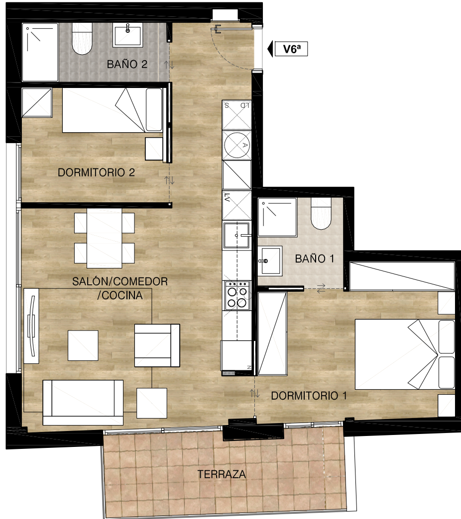
NIVEL 7 PLANTA ACCESO